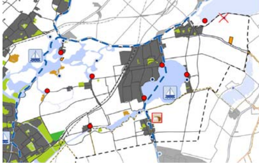
Aanpassingen kaart 3