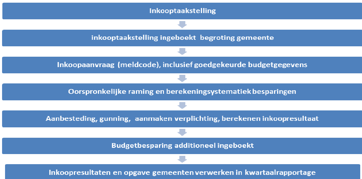
Figuur 4: schematische weergave processtappen verwerken inkoopresultaat

In onderstaande figuur 4 zijn de bovengenoemde stappen schematisch weergegeven.