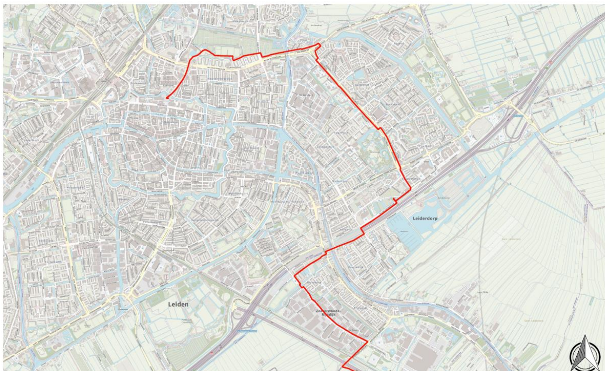
Figuur 1 - Conceptleiding tracé warmterotonde in de regio Holland Rijnland

De beschikbaarheid van warmtebronnen die warmte geven aan het regionale net hangt af van hoeveel restwarmte van de industrie in voornamelijk de Rotterdamse haven beschikbaar kan worden gemaakt en van de ontwikkeling van geothermie in voornamelijk het Westland. De theoretische potentie, zoals CE Delft in beeld heeft gebracht voor de Warmtealliantie, is voldoende om de geschikte warmtevraaggebieden in de regio rondom Leiden van warmte te voorzien. Voor het daadwerkelijk leveren van deze warmte aan Holland Rijnland zijn naast de transportinfrastructuur ook besluiten nodig over de aan te sluiten gebieden, en bijvoorbeeld het marktmodel en de financiering van het regionale net.